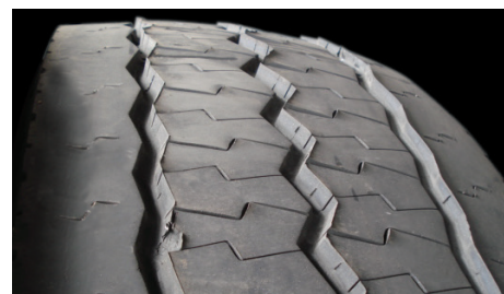
Usure radiale en bavures