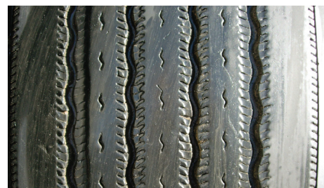
Usure en rivières/canaux