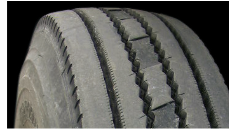
Usure en dépression (centrale)