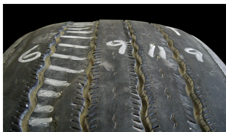
Usure en dépression (intermédiaire)