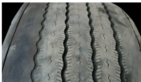
Usure étagée de l'épaule