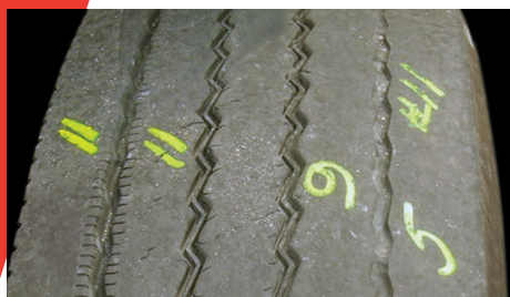
Usure marquée sur un côté